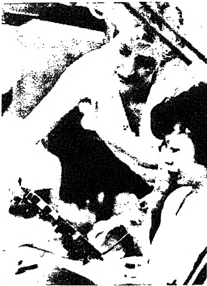
يبدأ ببيت، نائبة رئيس إحدى المؤسسات تعلم مبلر كل عمل وصل الدوائر الحكومية